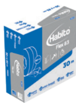
Uniwersalna taśma do narożników HABITO NO-COAT®

Gwarancję jakości Systemu RIGIPS (tj. połączeń, jakości wykończenia) zapewnia użycie rekomendowanych i kompletnych rozwiązań systemu RIGIPS (płyta RIGIPS, profile RIGIPS, akcesoria RIGIPS, masy RIGIPS). W przypadku zamiany komponentów na niesystemowe RIGIPS nie gwarantujemy cech użytkowych i wizualnych rozwiązań.